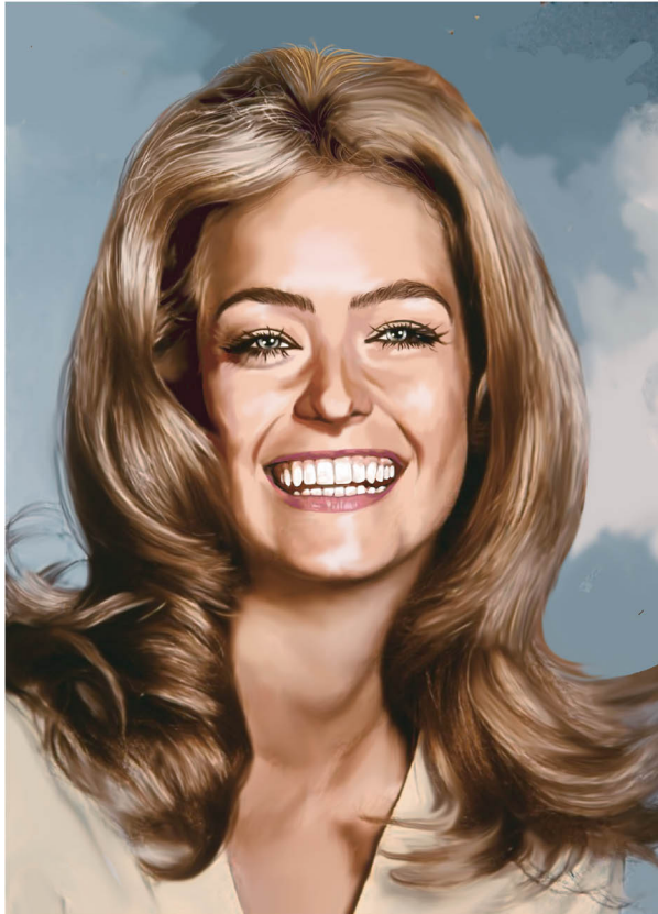
► Figura 1.8. Década de 1970 – Farrah Fawcett: sobrancelhas sem definição, menos destacadas e mais naturais.