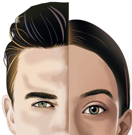
► Figura 1.1. Especificidades da face masculina em relação à feminina: testa maior em altura e largura, sobrancelhas mais projetadas na região da glabella, mais grossas e retas, com menor distância vertical entre a base das sobrancelhas e os olhos.

O design da moda das sobrancelhas femininas já mudou por diversas vezes, e elas já foram superfinas, retas, arqueadas ou grossas, tendo forte influência em toda uma geração ao comunicar o estilo e a personalidade da mulher. A seguir, iremos detalhar a história do design das sobrancelhas femininas nos últimos 100 anos ( Figura 1.2 ).