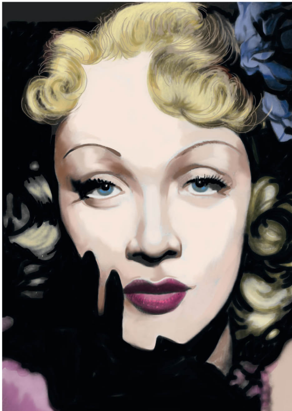
► Figura 1.4. Década de 1930 – Marlene Dietrich: sobrancelhas extremamente finas e arredondadas.