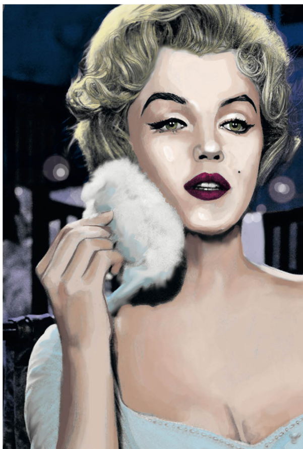
► Figura 1.6. Década de 1950 – Marilyn Monroe: sobrancelhas definidas, grossas e com arco em ângulo alto, com formato de “acento circunflexo”.